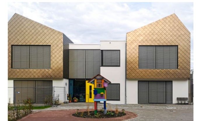
Die evangelische Kindertagesstätte Friedrich Fröbel