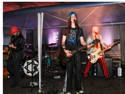
Musik aus dem Odenwald in Eppelheim

Da ist es klar, dass wir auch im Herbst, wenn die traditionelle Kerwe mit Straßenfest in Eppelheim gefeiert wird, aktiv dabei sind.