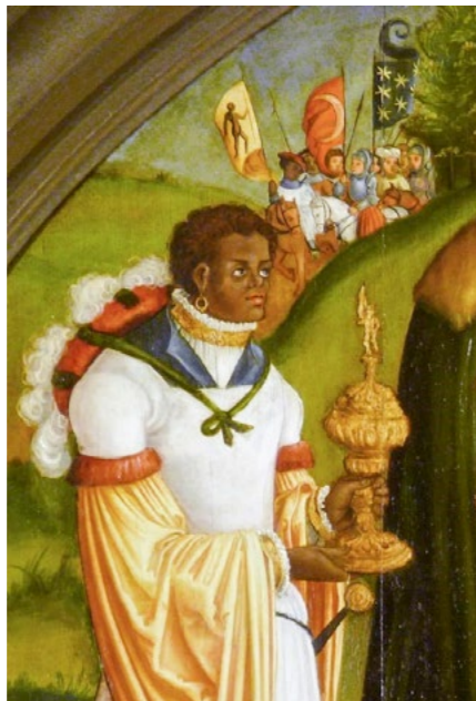
Altarbild in Nürnberg (1518) Bild: Theo Noll

der Dreizahl ihrer Gaben – Gold, Weihrauch, Myrrhe – wurde ihnen schon im christlichen Altertum die Dreizahl zugeordnet, und mit Hinweis auf Jes 60,3 („Völker werden zu deinem Lichte ziehen und Könige zum Glanz deines Aufgangs.“) wurden sie als Könige verehrt. Da die mittelalterliche Weltkarte nur drei Kontinente kennt – Asia, Europa, Africa –, wurden sie als Vertreter der drei Erdteile verstanden. Hier beginnt die Überlieferung vom schwarzen König als Vertreter der Völker Afrikas bei der Anbetung des göttlichen Kindes. Wo auf jahrhundertealten Gemälden das Gefolge der Könige dargestellt ist, zeigen ihre Fahnen die Symbole der drei Erdteile: den Halbmond für Asien, Sterne auf blauem Grund für Europa und eine schwarze Figur für Afrika.