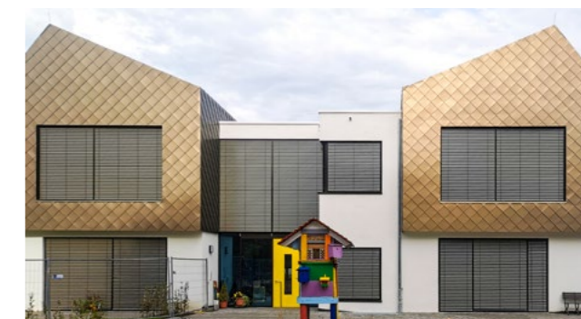
Die evangelische Kindertagesstätte Friedrich Fröbel