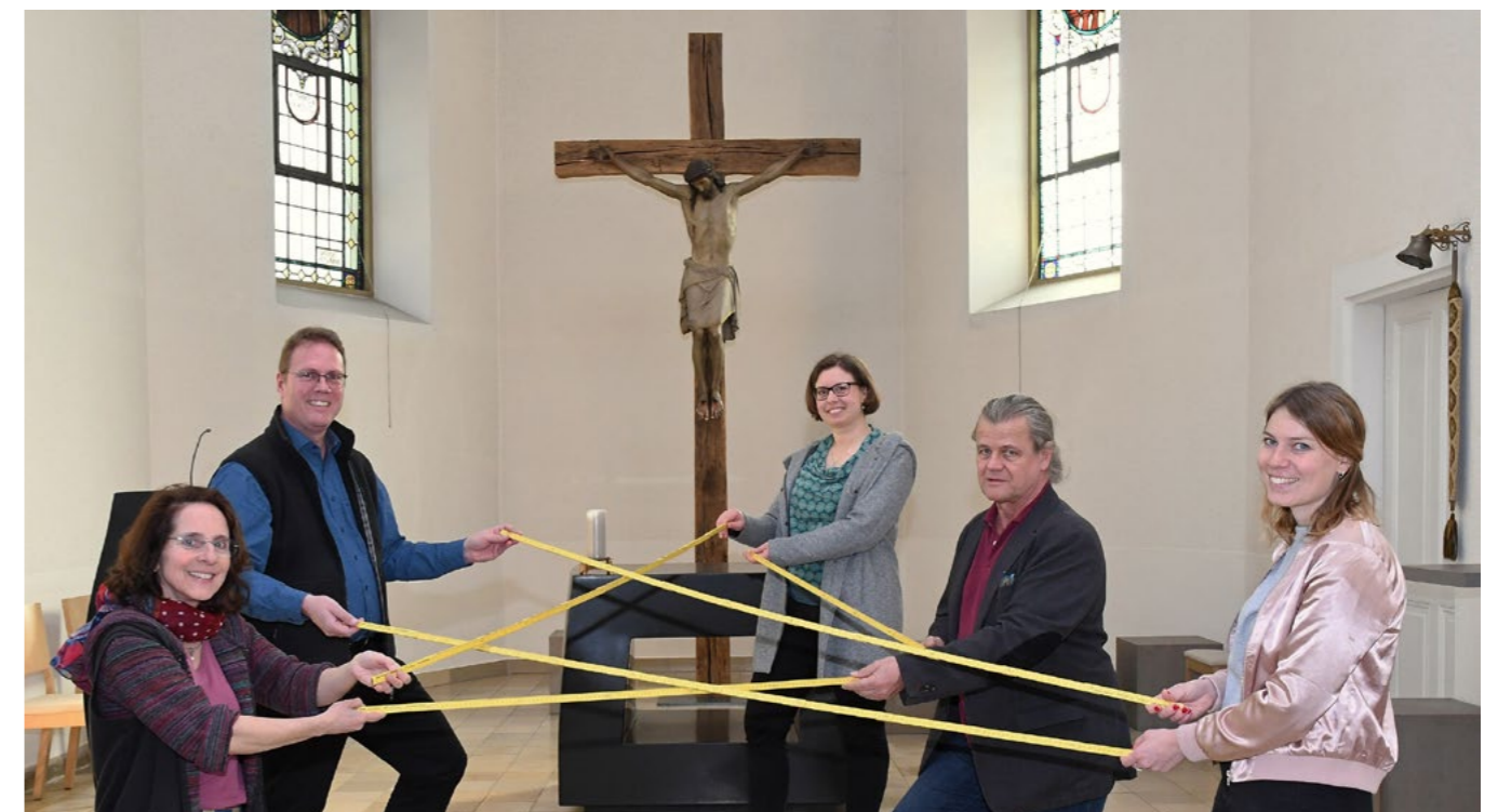
„Hilfe geben – Hilfe nehmen“

Zuversicht und Mut für alles, was kommt – Beharrlichkeit und Neugierde in allem Wandel – Gelassenheit in Dingen, die nicht zu ändern sind – Ausdauer in allem, was anders werden muss – dass sich Menschen finden, die die notwendige Arbeit mit Freude tun und Herausforderungen annehmen. Und – nicht zuletzt: Gottes Segen auf allen Wegen!