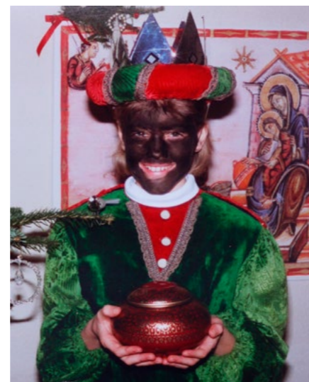
Ein schwarzer König 1989

Heute werden die Kinder belehrt, dass schwarze Menschen in Deutschland am Schwarzschildern Anstoß nehmen und es als Rassismus und Diskriminierung deuten, was der Glaubwürdigkeit der Sternsinger-Aktion schade.