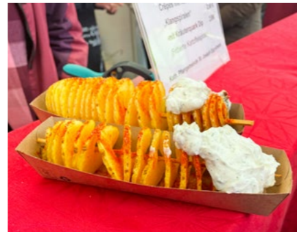
Klangspiralen (Kartoffelspiralen) nur hier auf der Kerwe