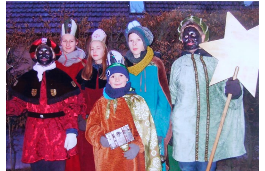
Eppelheimer Sternsinger 2017