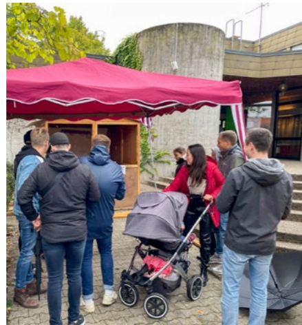
Herausforderung an der Wurfbude

Ansporn sind sicherlich auch die Preise: für Kinder und Jugendliche gibt es immer etwas Süßes und auf alle anderen wartet ein „Mutter Gottes Tropfen“ oder gar ein „Halleluja Wasser“.