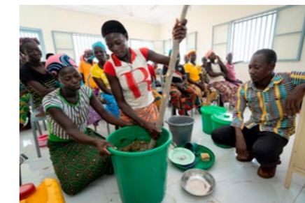
Kleinbauern in Burkina Faso

dass wir auf unserem Planeten nur gemeinsam eine Zukunft haben. Ein Partner von Brot für die Welt, das Office de Développement des Eglises Evangéliques (ODE), unterhält seit 1972 ein Ausbildungszentrum in Burkina Faso und versucht mit Schulungen in nachhaltigen Anbaumethoden für Kleinbauernfamilien ihre Existenz zu sichern.