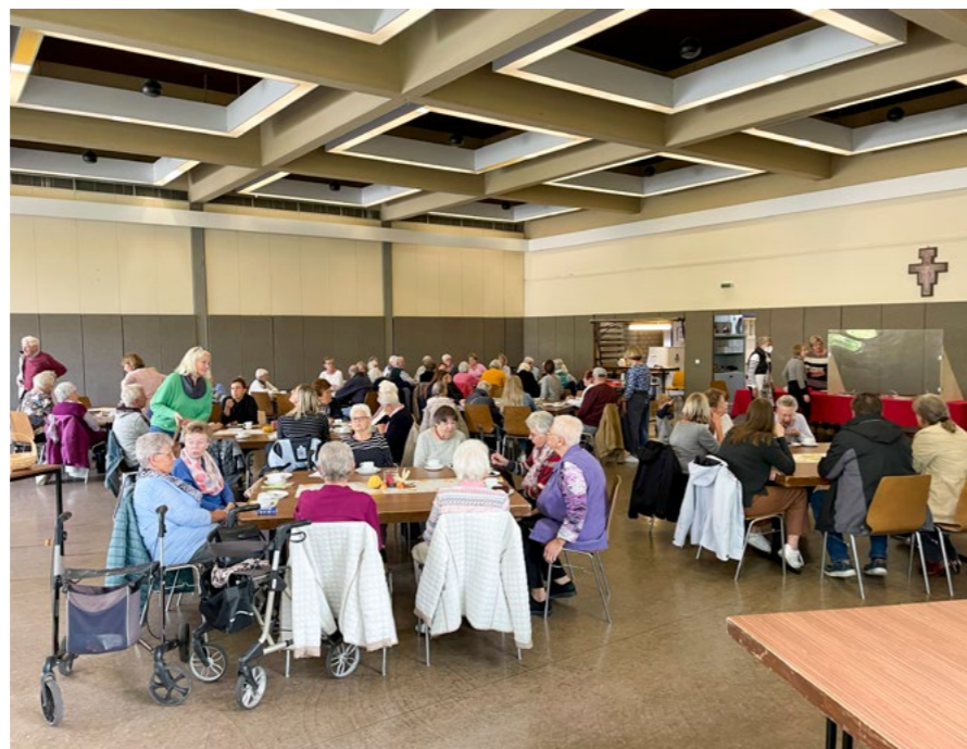
Ausklang am Kerwemontag im Kerwecafe