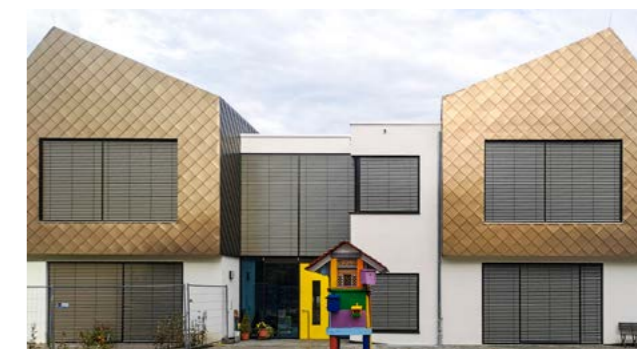
Die evangelische Kindertagesstätte Friedrich Fröbel