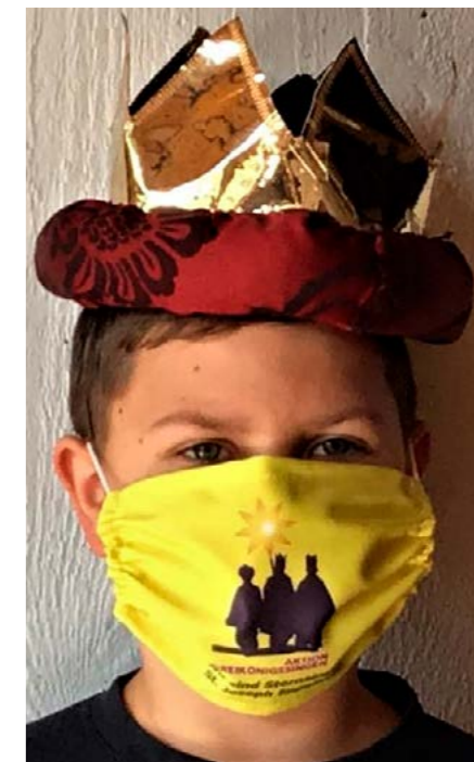
Sternsinger vorbereitet in Coronazeiten

Ob wir noch einmal den Segen der Krippe to go erteilen, oder ob ab 06. Januar wieder viele Kinder und Jugendliche durch die Eppelheimer Straßen ziehen und den Segen von der Krippe in die Häuser bringen? Wir wissen es heute noch nicht. Wir werden Sie weiter informieren.